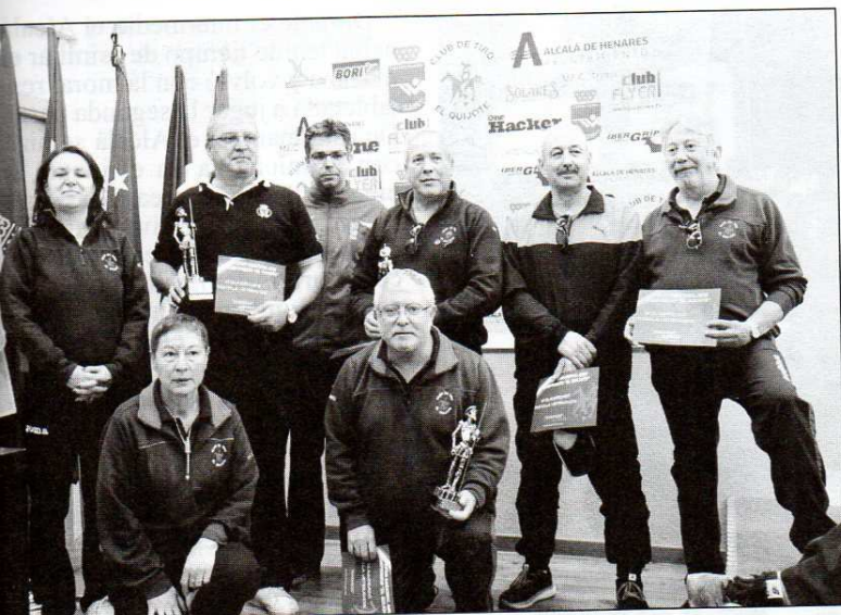
Podio de tiradores veteranos